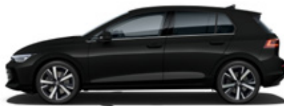
Grenadilla Black Metallic