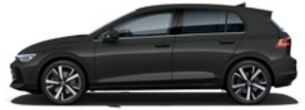
Dolphin Gray Metallic