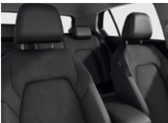
'Art Velours' Seat Soul Black