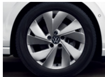
'Nottingham' 7.5J X 17" alloy wheels 225/45 R17 tyres (Premium 적용)