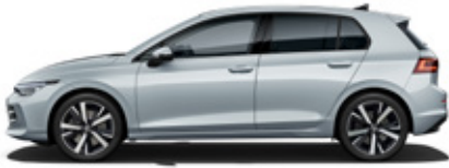
Oyster Silver Metallic