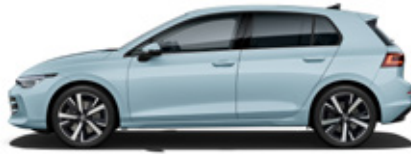
Crystal Ice Blue Metallic