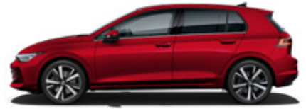
Kings Red Metallic