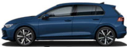
Anemone Blue Metallic