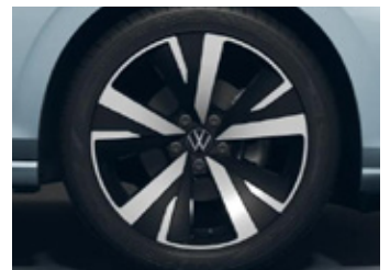
'Catania' 7.5J X 18" alloy wheels 225/40 R18 tyres (Prestige 적용)