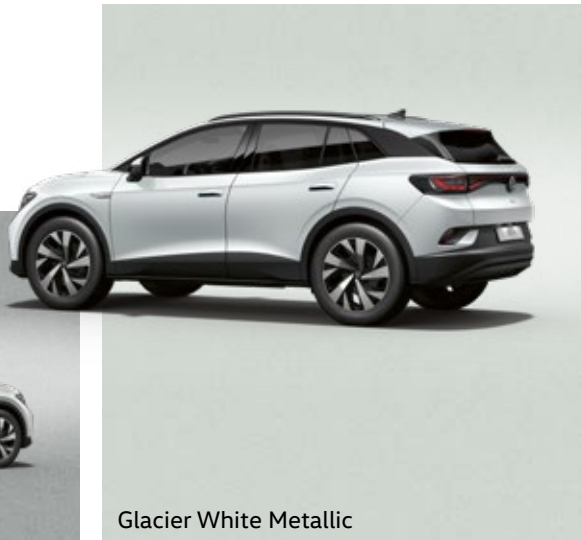
Glacier White Metallic