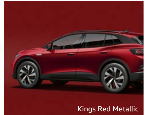
Kings Red Metallic