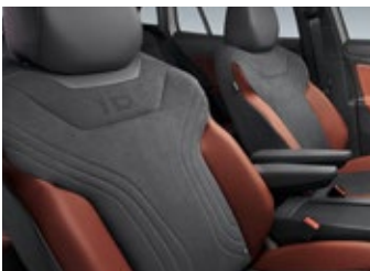
"Black" Artvelours + "Brown & Black" Leatherette Seat