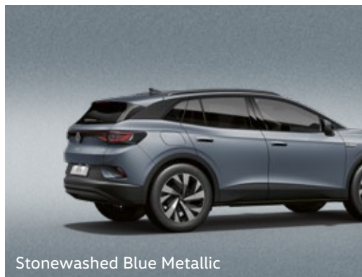
Stonewashed Blue Metallic