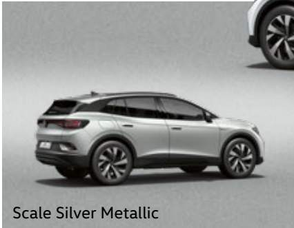
Scale Silver Metallic

* ID.4 ProLite는 Glacier White Metallic, Grenadilla Black Metallic만 선택 가능