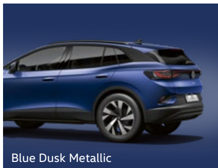
Blue Dusk Metallic