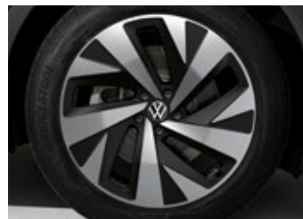
'Drammen' 9J x 20" alloy wheels Front tyres: 235/50 R20 Rear tyres: 255/45 R20